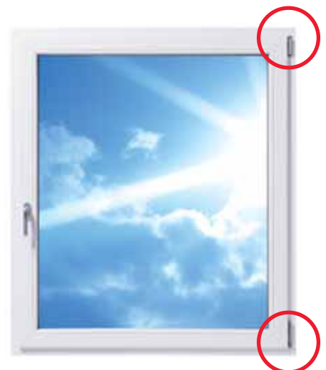
Ein herkömmliches Fenster mit sichtbaren Bändern