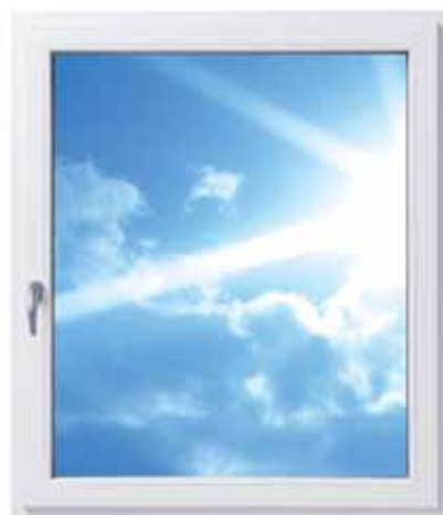
Ein Fenster mit Roto NT Designo und völlig verdeckt liegenden Bändern

Und obendrein spart man Zeit bei der Fensterreinigung. Roto hat diesen verdeckt liegenden Beschlag mit seiner eleganten, mattsilbernen Oberfläche neu entwickelt. Für schöne Holz- und Kunststoffenster, die hohen Komfort, exklusives Design und zahlreiche Gestaltungsmöglichkeiten bieten.